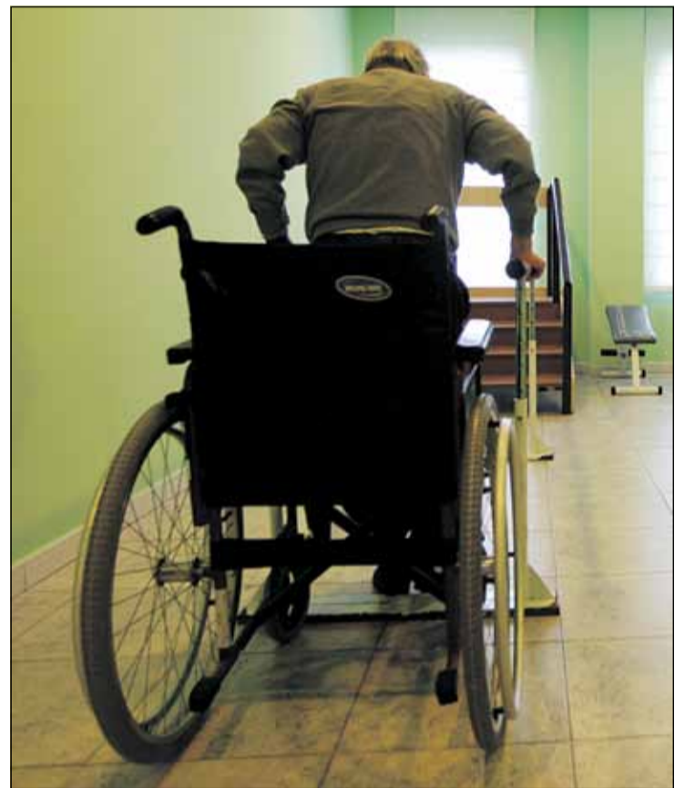
Un usuario en un gimnasio de una residencia.

potente prestación de cuidados en el domicilio. «Si en España se procuran en general unos 40 minutos al día en lo que atañe a la atención domiciliaria, en Dinamarca están dando 3,1 horas para ayudar a la persona a desplazarse, bañarse, comer o vestirse», asegura García Navarro.