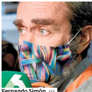
Fernando Simón. EFE

Ahora, el juez recibe una querrela de Abogados Cristianos y da traslado de la misma al Ministerio Público para que informe sobre de la competencia del órgano judicial y sobre eventual naturaleza penal de los hechos que se relatan en la querrela. La Fiscalía del Supremo ya se opuso a investigarlas. De momento, no existe «resolución