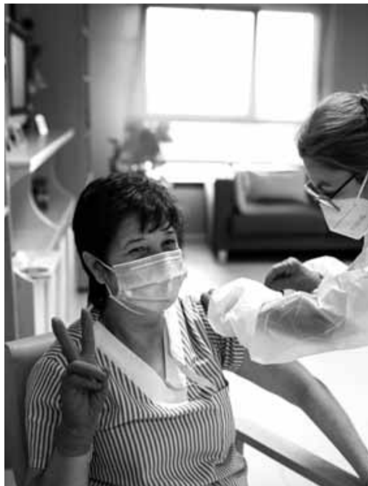
Una trabajadora de residencia se vacuna en Madrid.

Todas las asociaciones coinciden en que el documento de Sanidad, que plantea el cambio de ocupación de los trabajadores antivacunas, que se les controle la temperatura a diario y que se les haga dos test semanales, está desfasado. "Ya estamos cumpliendo esas medidas porque los protocolos autonómicos nos las exigen, incluso tres test a la semana que pagamos nosotros. Pero la solución no pasa por ahí", incide Fernán-