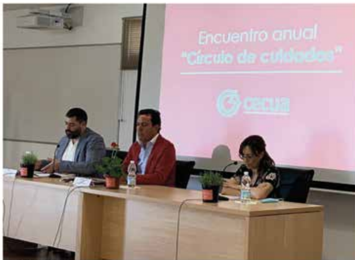
● Ruano de prensa de el CECUA