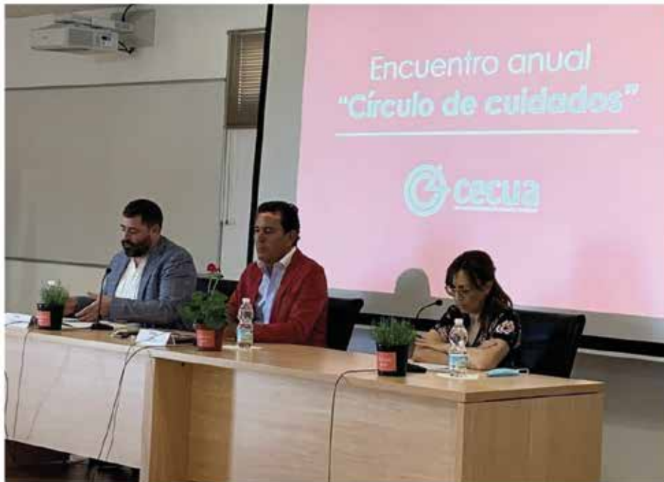
Presidencia de la Asamblea General de Cecua celebrada en Cabra (Córdoba)